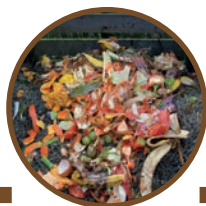
Reste de repas (viande, poisson, gâteau, fromage, pain)