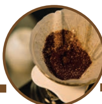
Thé et café