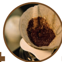
Thé et café