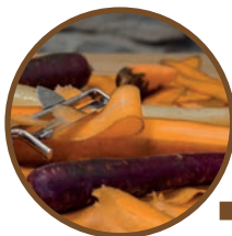
Épluchures, fruits et légumes