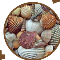
Coquilles d'oeuf et coquillages