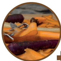
Épluchures, fruits et légumes