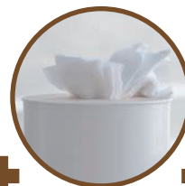
Essuié-tout, mouchoir, rouleau en carton