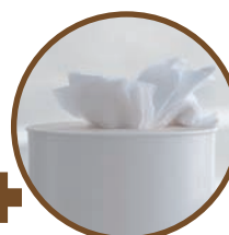
Essuié-tout, mouchoir, rouleau en carton