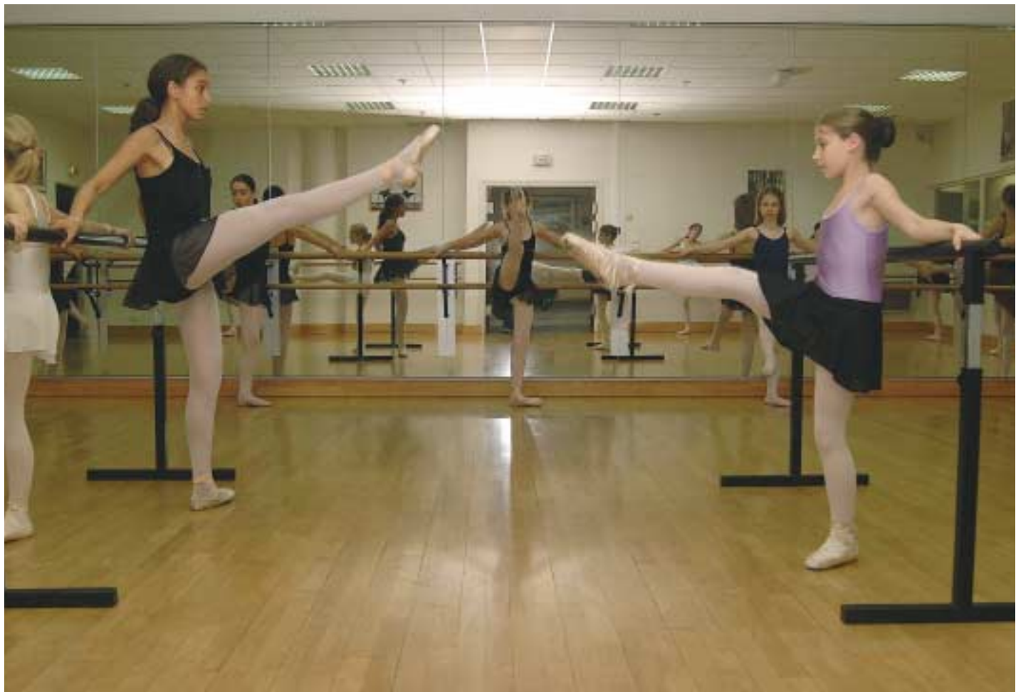
Danse classique à l'Académie de Danse de Charenton.

Une bourse annuelle pour favoriser la pratique d'activités des enfants de familles nombreuses