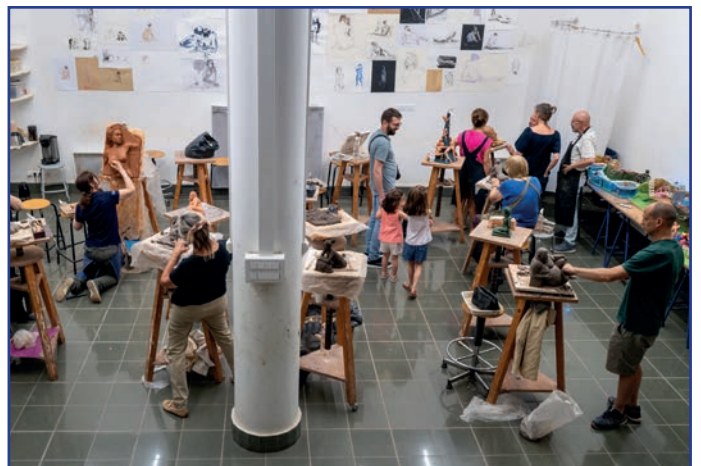
Lors des portes ouvertes de l'atelier d'arts plastiques Pierre Soulages 2025.