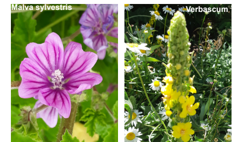
Les belles vagabondes

Il est essentiel que le jardinier ait pleinement conscience que l'eau constitue une ressource des plus précieuses. Elle est indispensable à toute forme de vie. Aussi faut-il développer des systèmes afin de recycler au maximum l'eau pour éviter qu'elle ne se perde. Récupérer l'eau de pluie, récupérer l'eau non consommée pour arroser les plantes doit constituer une base de tout jardin.