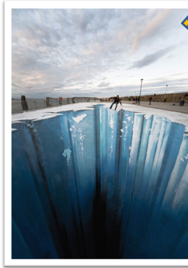
"Ice age" (Allemagne)

C'est un artiste allemand qui fait partie du mouvement Street Painting , il se consacre entièrement à la peinture de rue . Il réalise des dessins en perspective sur les sols à l'aide de craies et de peinture, et crée des compositions en trois dimensions à couper le souffle.