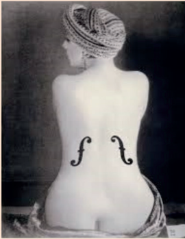
Violon d'Ingres – 1926 MAN RAY