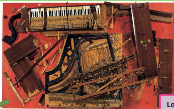
ARMAN- Chopin's Waterloo -1962

"Quand la Musique rencontre les Arts Plastiques"