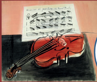
Le violon Rouge – 1948 – Raoul DUFY

"Quand la Musique rencontre les Arts Plastiques"