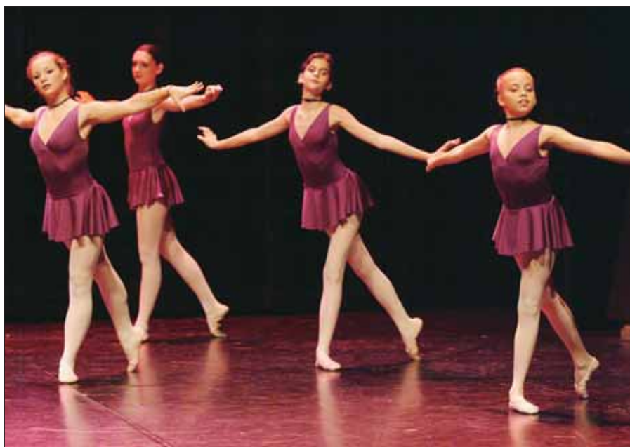
Gala de l'Académie de danse de Charenton au T2R.

désormais ouverte durant l'été. Témoins de la vitalité sportive de la ville, ses excel-