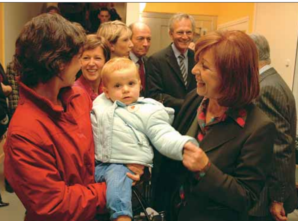
Inauguration de la crèche des Bordeaux par Marie-Josée Roig, Ministre de la Famille et de l'Enfance.

à une centrale d'écoute permanente. Les personnes ayant des difficultés à se déplacer peuvent bénéficier du "bus service", système de transport spécifique sur la commune. Enfin, la Ville affirme sa solidarité vis-à-vis des anciens qui disposent de faibles ressources à travers deux prestations : le complément mensuel de ressources et la prime de chauffage.