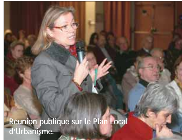
Réunion publique sur le Plan Local d'Urbanisme.