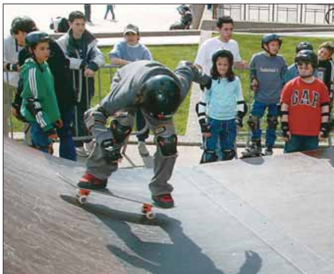
Journée glisse urbaine et skate board organisée par le CMJ.

ciples pour un mandat de deux ans à l'issue de véritables élections qui ont eu lieu les 13 et 14 novembre 2003, il a déjà pu mettre en œuvre des projets tels qu'un festival de cinéma en plein air ou encore l'installation, à titre provisoire, d'un skate parc. □