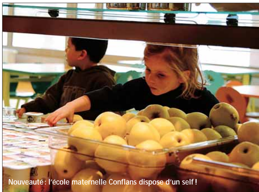
Nouveauté : l'école maternelle Conflans dispose d'un self !

Des séjours variés à la mer, à la montagne, ou sur des thèmes particuliers sont aujourd'hui proposés aux jeunes en partenariat avec l'Aliaj en fonction des tranches d'âge. Pour permettre à toutes les familles de bénéficier de ces nouvelles destinations de vacances, la Ville prend en charge 20 à 80 % du prix du séjour.