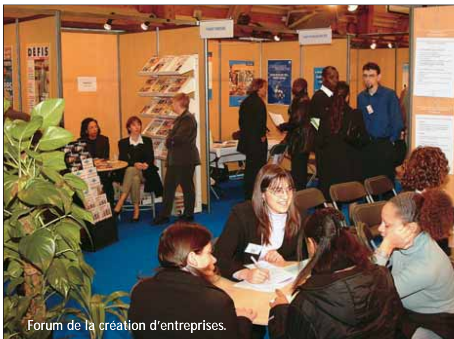
Forum de la création d'entreprises.

Charenton peut s'enorgueillir d'un exceptionnel dynamisme économique. La ville accueille de nombreuses entreprises du secteur tertiaire, au bénéfice de tous.