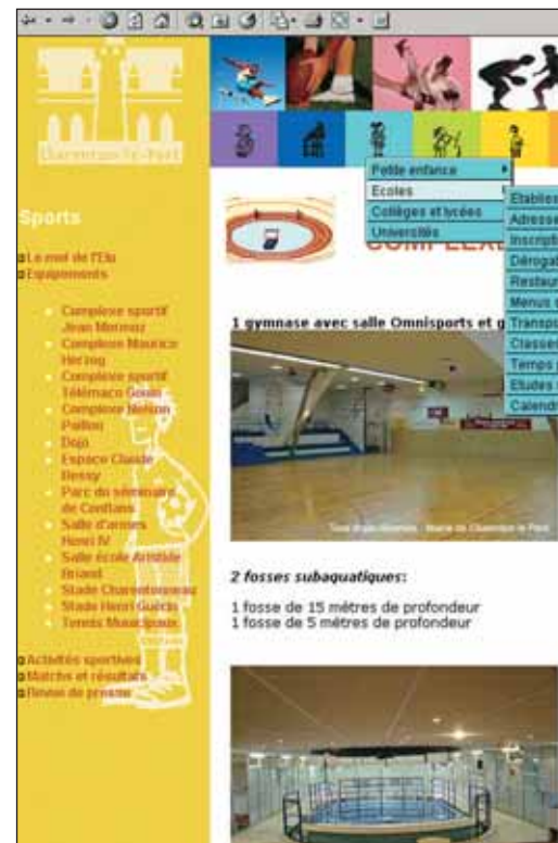
La rubrique sport du site Internet de la ville aux Labels Ville Internet en 2003 et en 2004.

“Charenton a connu un remarquable essor démographique”