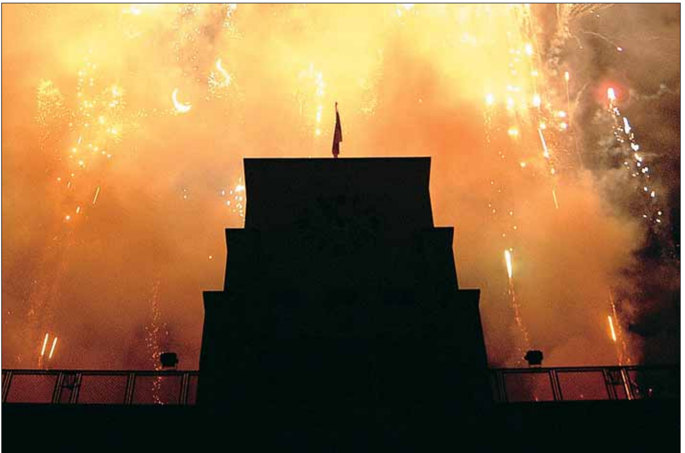
Feux d'artifice à l'occasion des feux de la Saint-Jean.