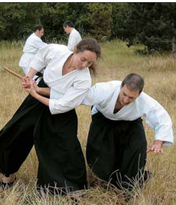
Aikido, un art martial pratiqué sur la commune.