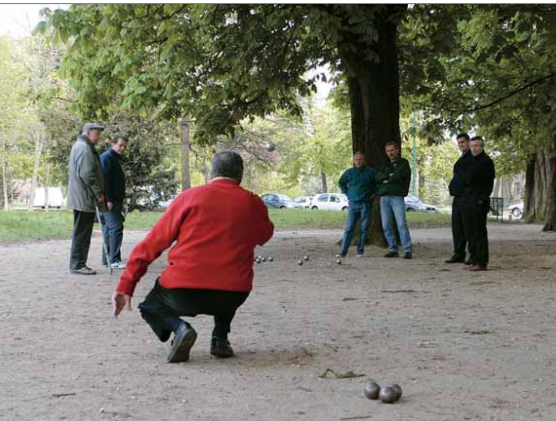
Tournoi de pétanque dans le bois de Vincennes.

première partie du mandat, l'organisation, le 15 septembre 2002 du 1 er Forum des Associations en centre ville : pour la première fois en effet, étaient réunies dans un même lieu convivial et facile d'accès l'ensemble des associations oeuvrant dans tous les domaines touchant à la vie quotidienne des Charentonnais : sport, culture, loisirs, solidarité, etc, en tout plus de 70 exposants. Devant le succès de cette opération, le Forum a été reconduit en 2003 et 2004 et, avec une fréquentation annuelle de plus de 4 000 personnes, il constitue désormais un événement incontournable de la vie charentonnaise. □