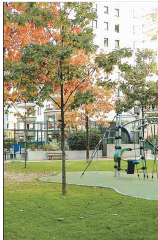
Une nouvelle aire de jeux dans le jardin Card...

La ville de Charenton-le-Pont présente une bonne santé financière : loin d'être de l'auto satisfaction, c'est le jugement porté sur nos comptes tant par des consultants indépendants spécialisés en finances locales que par des établissements financiers.