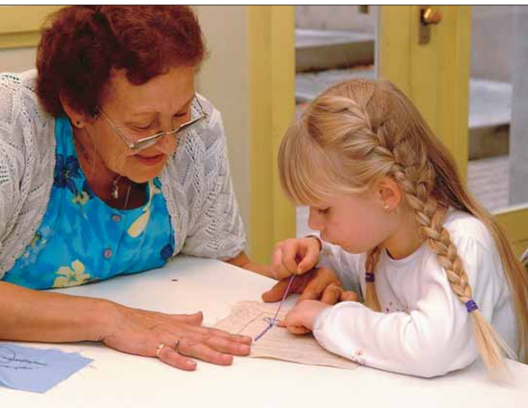
Atelier intergénérationnel, dans le cadre de la Semaine bleue.

pas moins que, quels que soient les efforts déployés en la matière par la Ville, il sera difficile de satisfaire l'ensemble des demandes, motivées non seulement par le fort dynamisme démographique, mais également par le taux exceptionnel d'activité des femmes en âge de travailler, puisqu'il se situe à 84 %. Le printemps 2004 a vu la réouverture de la crèche des Bordeaux, entièrement reconstruite. Par ailleurs, des travaux de rénovation ont été effectués dans les crèches "Bleu" et "Petit Château". Enfin, le Centre Communal d'Action Sociale (CCAS) attribue de nombreuses aides aux familles afin de contribuer aux charges induites par la venue d'un enfant : primes de naissance, prime de rentrée scolaire ou encore prestations en faveur des familles qui n'ont pu obtenir de place en crèche afin de compenser la différence entre le coût d'une assistante maternelle et celui de l'accueil en structure collective.