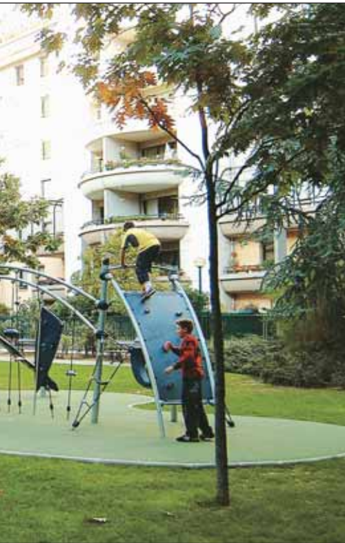
al de Richelieu à Bercy.

rieurs de près de 30 % à la moyenne départementale.