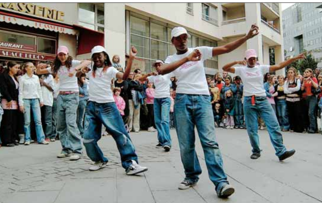
Fête de la musique dans le quartier de Bercy avec les jeunes d'Aliaj.