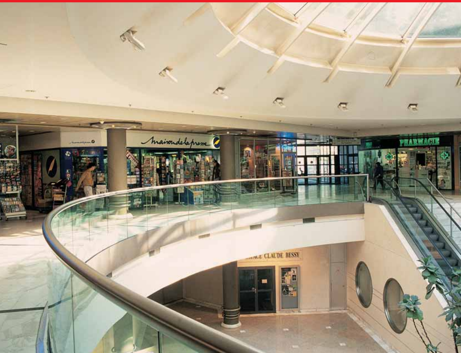
Galerie commerciale la Coupole - Liberté.