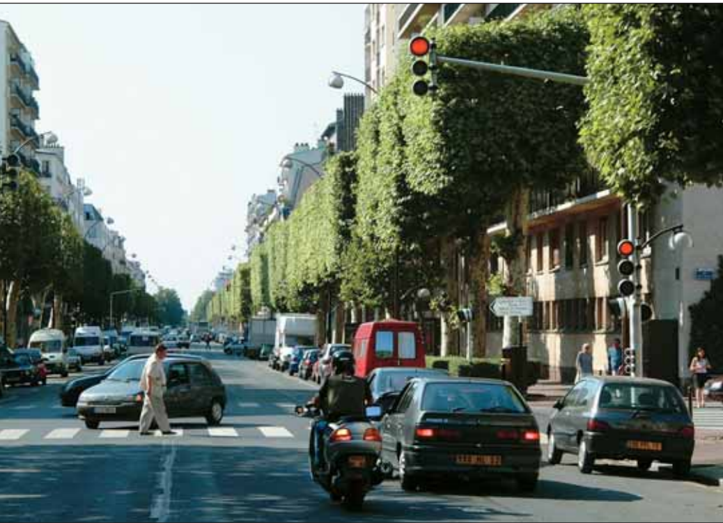
Rue de Paris, axe central de la ville.

mettant en cohérence et en complétant des équipements et services proposés à la population ;