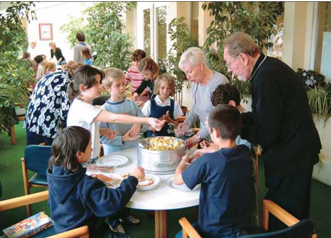
Atelier cuisine intergénération, au centre Alexandre Portier.

(semaine bleue en octobre, goûters, etc.)