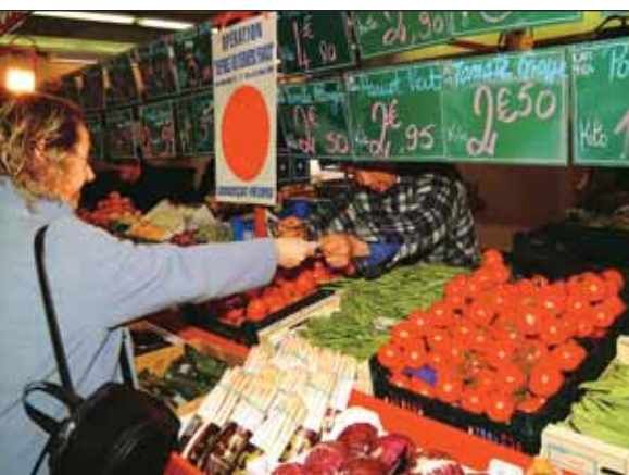
Opération derniers francs au marché couvert.

Les actions à mener pour soutenir les commerçants et les artisans charentonnais et mauritiens doivent être abordés de façon stratégique. La communauté de communes de Charenton le Pont - Saint Maurice, désormais compétente pour toutes les questions à caractère économique, prévoit d'engager, sur les deux communes, une étude sur la situation du commerce de détails et son avenir. Elle sollicitera le financement du FISAC (Fonds d'Intervention pour le Soutien de l'Artisanat et le Commerce).