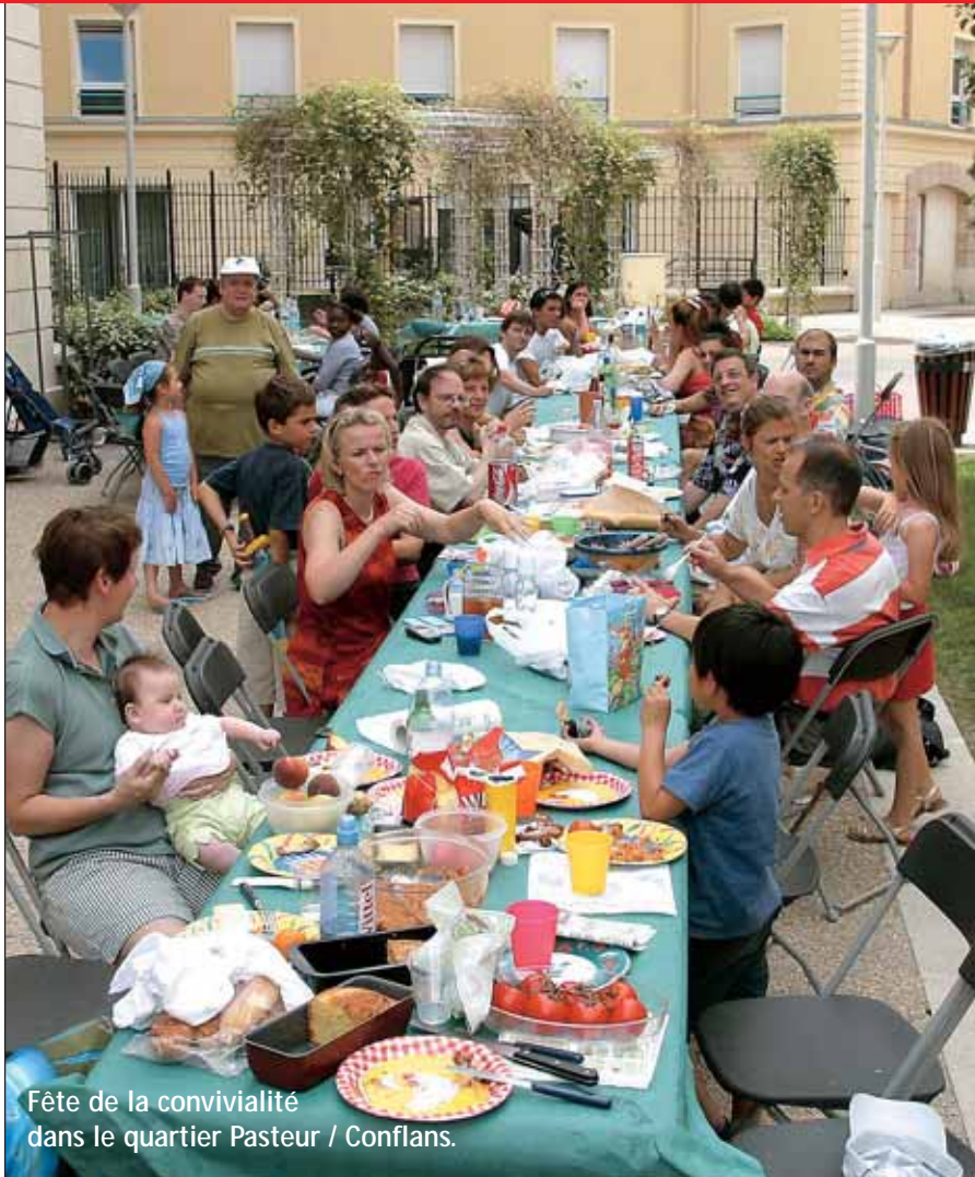
Fête de la convivialité dans le quartier Pasteur / Conflans.