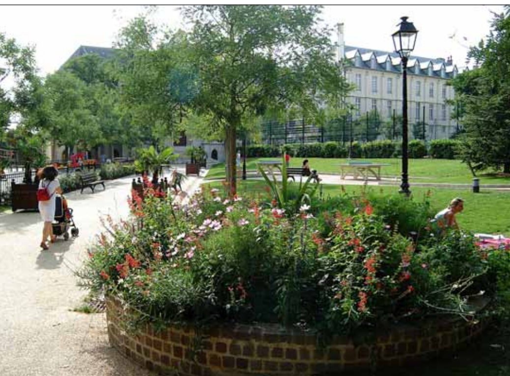
Le parc de Conflans, un espace de verdure et de détente dans le quartier Pasteur.

Située aux portes de Paris et bénéficiant d'une desserte particulièrement performante (proximité immédiate de l'autoroute A4, 2 stations sur la ligne 8 du métro et 5 lignes de bus), Charenton a tout pour réussir.