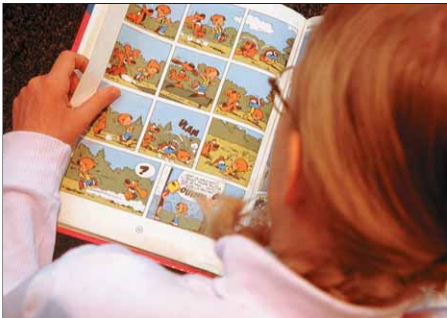
Les bibliothèques municipales permettent de s'évader par la lecture.

Charenton est désormais dotée d'un équipement culturel - constitué de deux salles - à la hauteur des ambitions de la Municipalité en matière culturelle. Au delà de l'opération d'investissement elle-même, l'approche de la nouvelle équipe a consisté à assigner des objectifs précis : tout en demeurant un lieu de spectacle à destination du grand public, le théâtre a également vocation à devenir un lieu de création et de formation (cf. encadré).