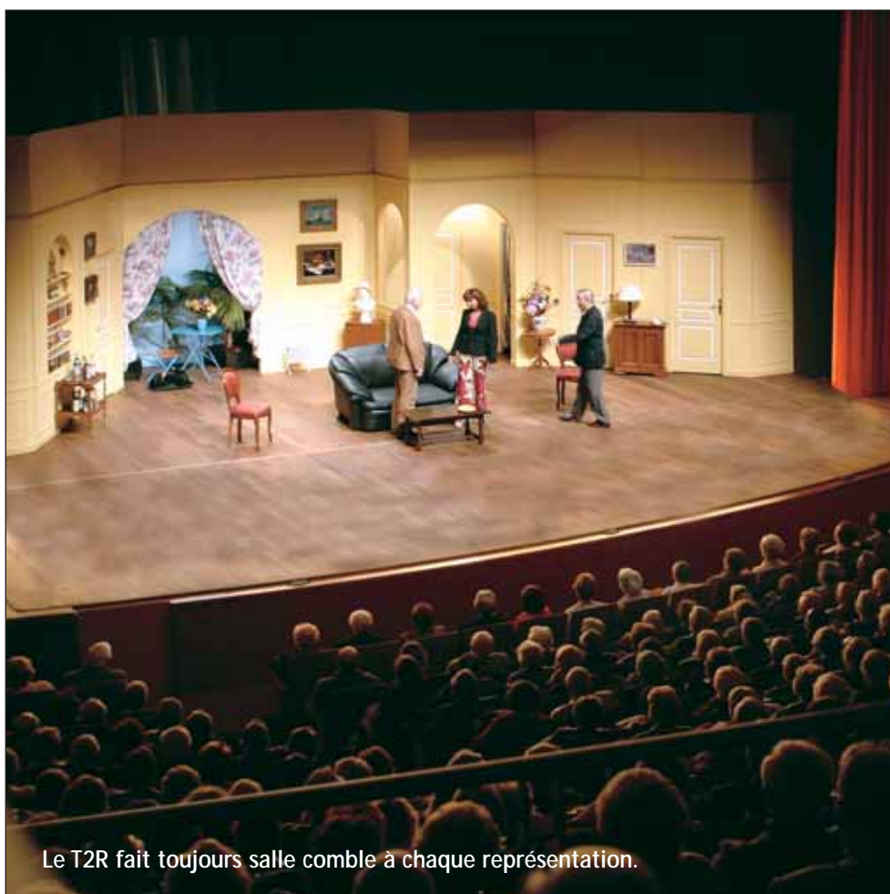
Le T2R fait toujours salle comble à chaque représentation.