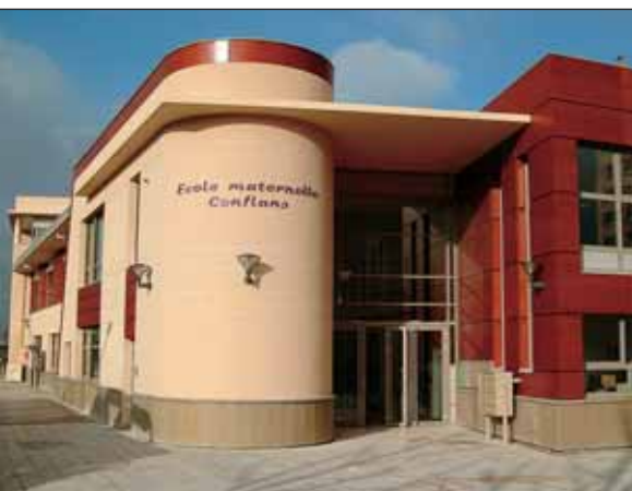
Ecole maternelle Conflans

L'éducation constitue, plus que jamais, la grande priorité du Maire et de la Municipalité. C'est ainsi que, depuis 2001, un effort considérable a été entrepris pour la constante amélioration des bâtiments scolaires.