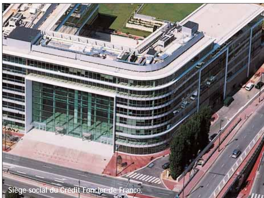
Siège social du Crédit Foncier de France.

renforcer et fidéliser son tissu économique, de renforcer les liens avec les entreprises et de leur proposer une palette toujours plus complète de services : mise en place d'un observatoire sur les entreprises, la fiscalité et les données socio-économiques ; création d'une bourse aux locaux vacants ; accompagnement des créateurs d'entreprise ou encore création et actualisation permanente d'une rubrique "entreprendre" sur le site Internet de la ville.