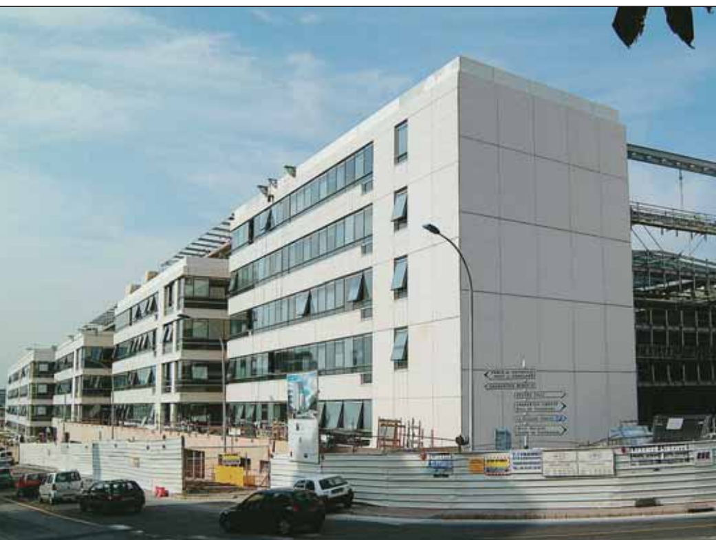
Futur siège du groupe bancaire Natexis Banques Populaires dans le quartier de Bercy.

D éterminée à faire fructifier les atouts indéniables de Charenton sur le plan de l'attractivité économique (qualité du cadre de vie, fiscalité raisonnable, proximité de la capitale, desserte par le métro), la Municipalité a mis en place, dès 2001, une politique volontariste en faveur du développement économique de la cité.