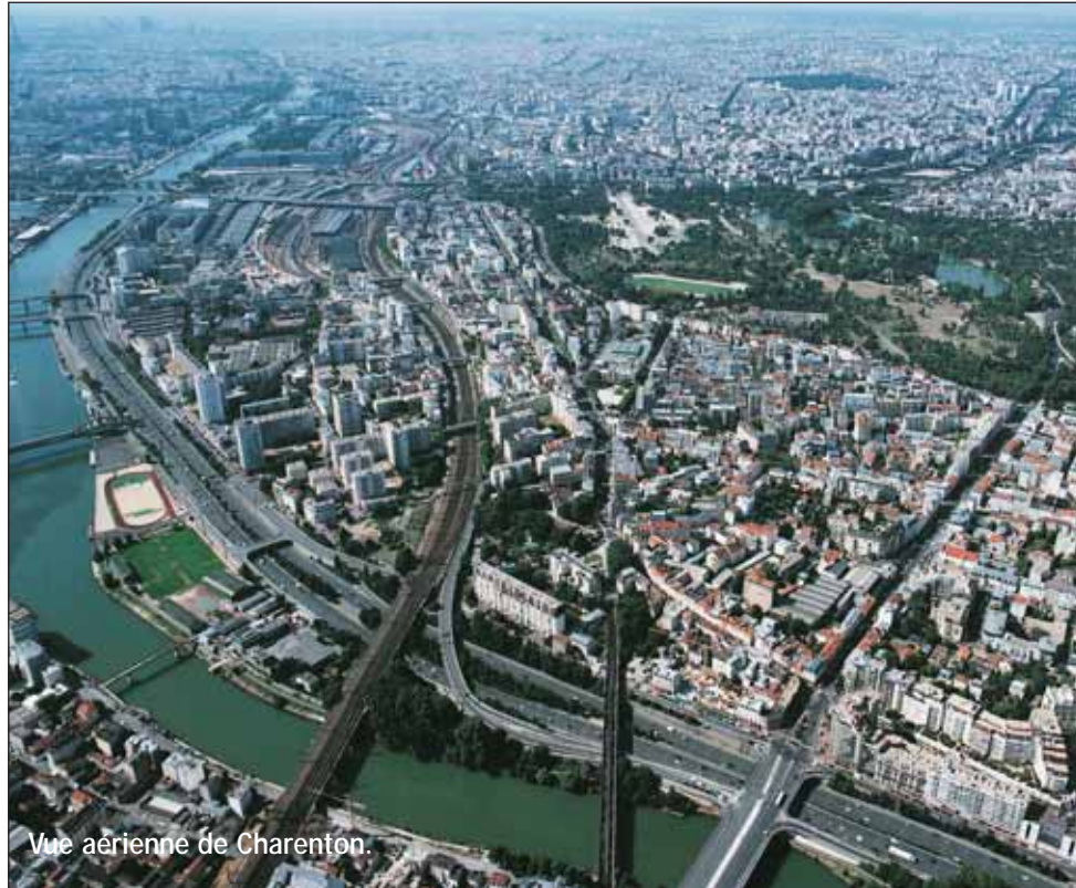
Vue aérienne de Charenton.

A la fois cause et conséquence de ce dynamisme démographique, Charenton est certainement la ville du Val-de-Marne à offrir la plus large palette de services à ses habitants. Les dépenses consacrées au fonctionnement des services proposés aux Charentonnais s'établissent en effet à 1 389 € par habitant, contre 1 141 € pour la moyenne départementale. L'effort d'investissement a également fortement augmenté depuis 2001. Comme on le verra dans ce document, les dépenses de fonctionnement et d'investissement