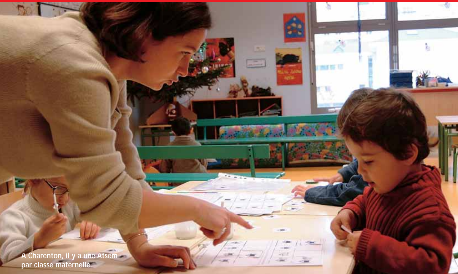
A Charenton, il y a une Atsem par classe maternelle.

maternelles, de la petite à la grande section, bénéficient de la présence d'une ATSEM (Agent territorial spécialisé des écoles maternelles), ce qui revient à seconder chaque enseignant. Enfin, la Ville continue de soutenir les classes transplantées en prenant en charge 50 % de leur coût. C'est ainsi que, durant l'année scolaire 2004 -2005, 13 classes représentant 350 enfants bénéficieront de ce dispositif.