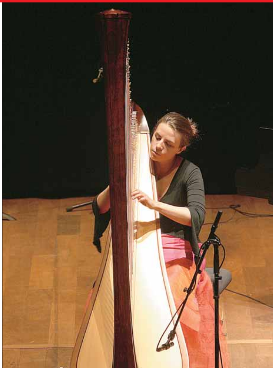
Concert des jeunes talents du Conservatoire André Navarra.

Le Conservatoire municipal de musique André Navarra forme chaque année environ 750 jeunes à la pratique musicale. Ici aussi, l'ouverture des différents modes d'expression culturelle à des publics toujours plus diversifiés est de mise. C'est ainsi que des cours pour adultes sont désormais proposés : initialement organisés pour le seul piano, ces cours vont progressivement s'étendre à d'autres disciplines instrumentales. Signe d'un dynamisme indéniable et d'un rayonnement qui dépasse largement les limites de la commune, l'atelier d'arts plastiques Pierre Soulages s'est agrandi durant la première partie du mandat en utilisant la salle Marguerite de Navarre. La Ville a instauré un cycle de quatre ans qui permet ainsi à un plus grand nombre de personnes de bénéficier d'une initiation ou d'un perfection-