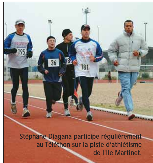
Stéphane Diagana participe régulièrement au Téléthon sur la piste d'athlétisme de l'Île Martinet.

naises. Chaque année, la Ville soutient financièrement des dizaines d'associations pour un montant total de 1,1 million d'euros. L'année 2002 a été marquée par l'inauguration, le 25 avril, de la Maison des associations Maurice Brouquier. Celle-ci occupe désormais un vaste espace de 170 m 2 qui abrite la Société d'Archéologie et d'Histoire, la Protection civile, le Comité de jumelage et ses différentes sections, ainsi que l'association "Les Foulées des Communaux". Autre événement marquant de cette