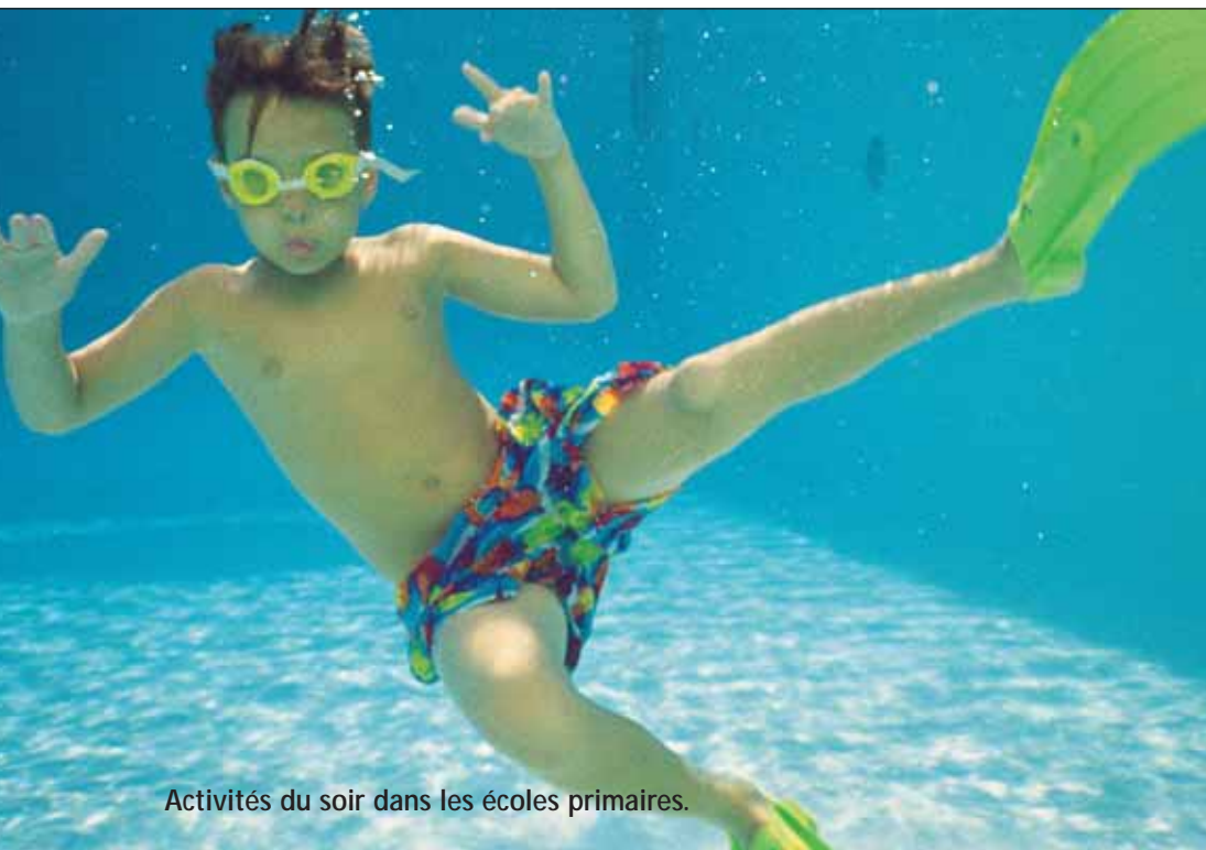
Activités du soir dans les écoles primaires.