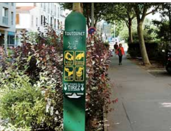
Des toutounets, distributeurs de sacs plastique pour les propriétaires de chiens.

gement du parc de Conflans demeure la grande réalisation de ces dernières années. L'hectare et demi de l'ancien séminaire a ainsi été entièrement repensé : l'espace a été divisé en deux zones distinctes, consacrées respectivement aux jeunes enfants et mères de famille et aux enfants plus âgés qui peuvent y pratiquer des jeux de ballon ou du tennis de table. Une liaison verte relie désormais la rue de l'Archevêché à la villa Bergerac afin d'améliorer l'accessibilité des piétons et de créer une nouvelle perspective visuelle. Une nouvelle