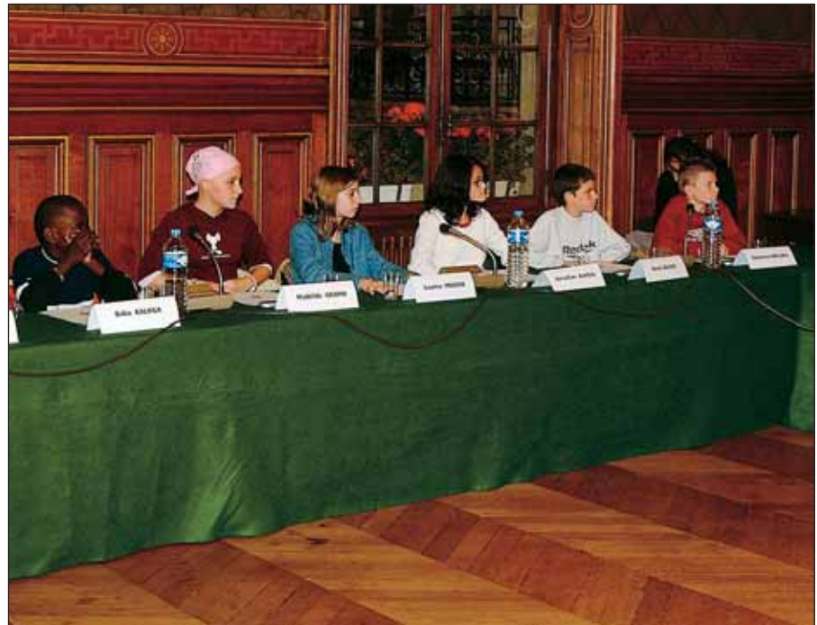
Installation du Conseil Municipal des jeunes en novembre 2003.

Toutes les écoles de la ville sont informatisées.