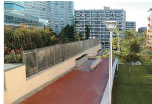
Allée Mahaut d'Artois : la trame verte progresse.

Charenton dispose d'un patrimoine de 7 hectares d'espaces verts qui contribuent à la qualité de vie de ses habitants. La Ville œuvre au quotidien pour les entretenir et les embellir. En outre, commune riveraine du bois de Vincennes, Charenton agit en partenariat avec les autres communes concernées pour la préservation de ce poumon vert de l'Est parisien.