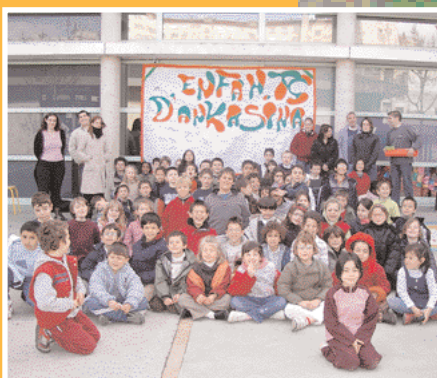
Inscriptions aux Centres de loisirs