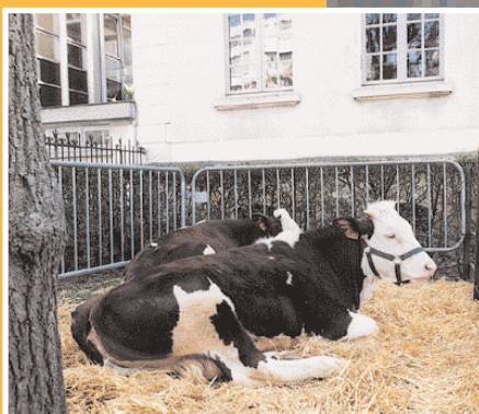
Marché Gaulois 4, 5 et 6 juin