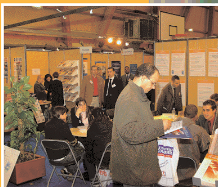
Réunion d'information sur la création d'entreprise