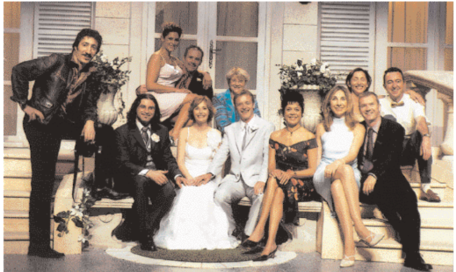
« Un Vrai Bonheur »

Au-delà de cette brève présentation, nous vous invitons à prendre connais-