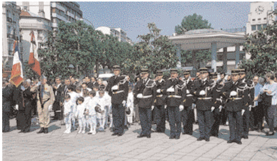
Commémoration au monument aux morts.

Cette journée exceptionnelle s'est terminée par un banquet offert aux Anciens combattants par les villes de Charenton et de Saint-Maurice.