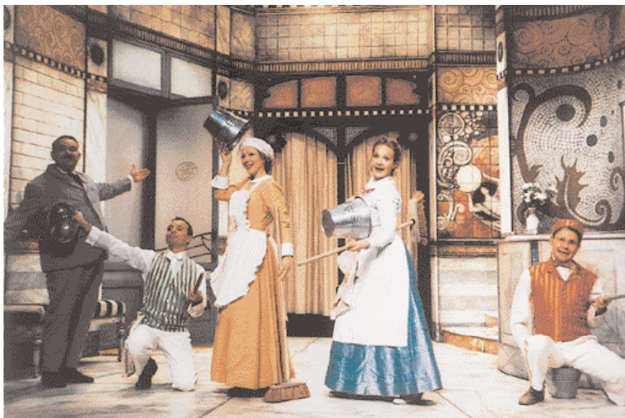
« Frou-Frou les bains »

107, rue de Paris : du lundi au vendredi de 9 h 30 à 12 h et de 13 h à 18 h Tél. 01 46 76 67 00