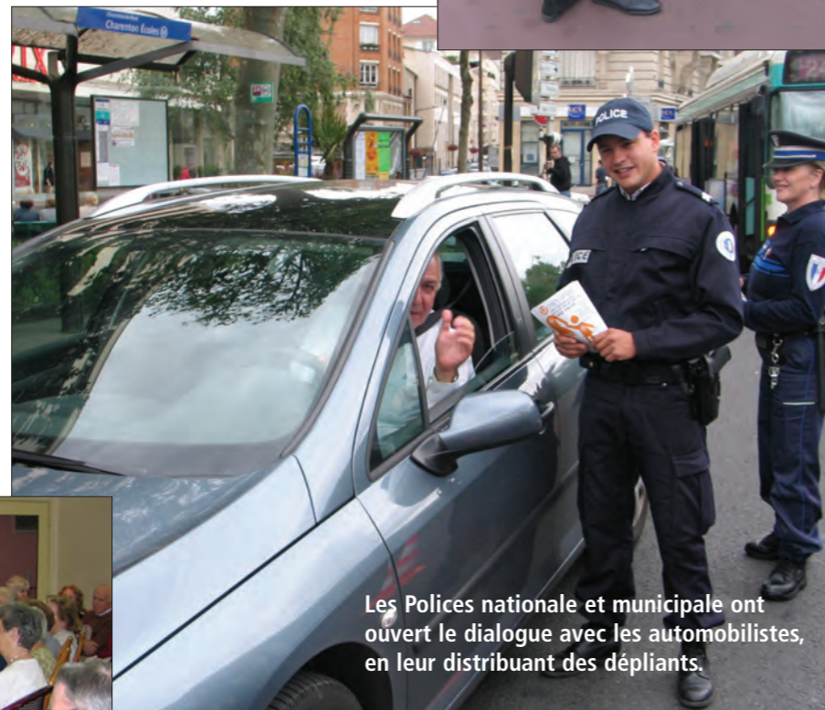
Les Polices nationale et municipale ont ouvert le dialogue avec les automobilistes, en leur distribuant des dépliants.