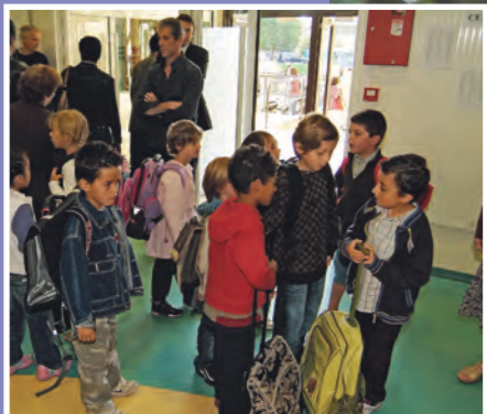
Une rentrée scolaire réussie !