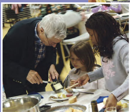
La Semaine bleue du 14 au 20 octobre