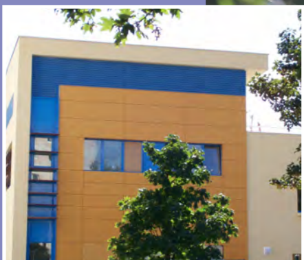
Ouverture de l'Espace Jeunesse (Aliaj)