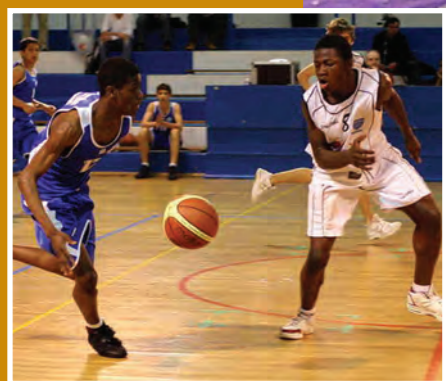
Les minimes de la St-Charles Basket Ball, Champions de France !