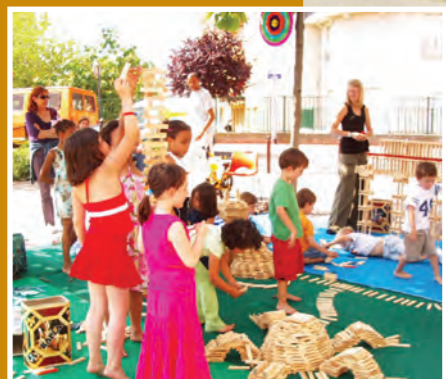
Centres de loisirs : au bonheur des enfants !