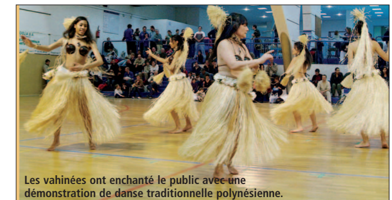
Les vahinéennes ont enchanté le public avec une démonstration de danse traditionnelle polynésienne.

Le 3 février dernier, dans le cadre des 32 èmes de finale de la Coupe de France, la Saint-Charles Charenton Saint-Maurice Basket-ball a disputé un match très engagé contre le club polynésien, l'AS Aorai. Après prolongation, la Saint Charles s'est imposée 85 à 83. Au-delà de cette rencontre, parrainée par Stéphane Diagana, de nombreuses animations avec fanfare, danseuses tahitiennes ont ravi le public venu nombreux pour encourager l'équipe première. ■