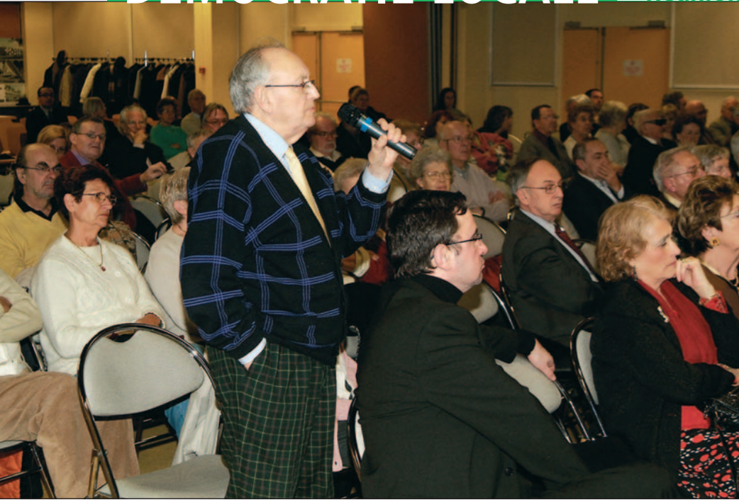
Près de 200 habitants du quartier Centre étaient présents, afin de débattre avec leurs élus des questions spécifiques à leur quartier, dans un esprit constructif.