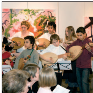
Les élèves de la classe de Luth du Conservatoire.

diverses œuvres de compositeurs, mais aussi quelques improvisations, accompagnés par 50 élèves du Conservatoire municipal de Musique André Navarra. Un excellent moyen de découvrir une musique qui utilise de nombreux instruments traditionnels du Moyen-Orient, mais qui se révèle néanmoins en perpétuelle évolution.