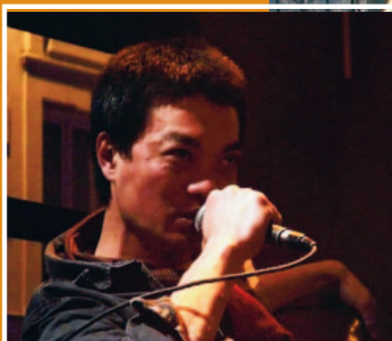
Le Printemps des poètes du 7 au 18 mars 2007