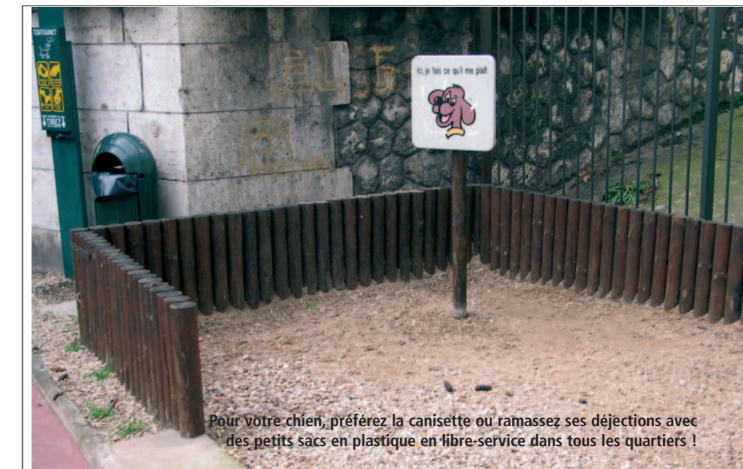
Pour votre chien, préférez la canisette ou ramassez ses déjections avec des petits sacs en plastique en libre-service dans tous les quartiers !