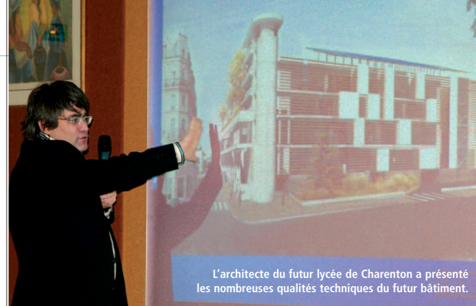
L'architecte du futur lycée de Charenton a présenté les nombreuses qualités techniques du futur bâtiment.

Prévue initialement rue de la Mairie, cette maison verra le jour sur un terrain qui s'est libéré à l'angle de l'avenue de Lattre de Tassigny et de la rue Gabriel Péri. Elle disposera de 72 lits dont 12 réservés aux malades atteints d'Alzheimer. L'établissement sera éligible à l'aide sociale et donc accessible aux personnes disposant aussi de petites retraites. Après l'accord nécessaire du Conseil Général sur le projet, 13 mois sont prévus pour sa construction par l'OPAC du Val-de-Marne. L'actuelle école maternelle des 4 Vents sera également reconstruite et agrandie.