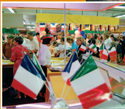
Dimanche 25 mars La fête des Comités de Jumelage