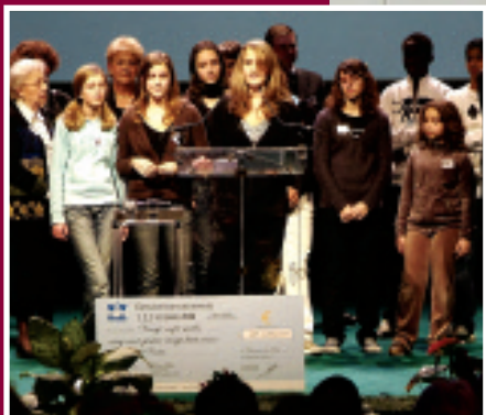
Vœux du Maire, les Charentonnais à l'honneur