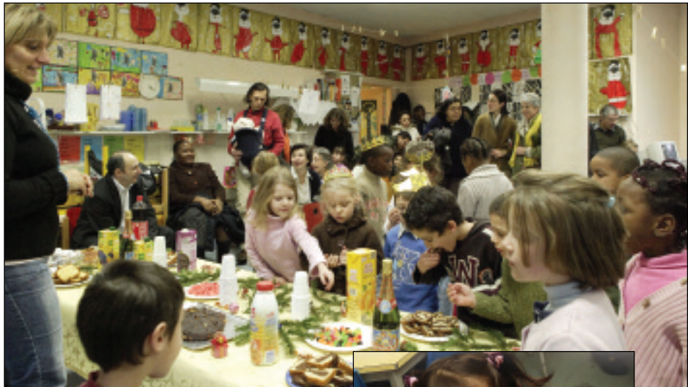
Ecole maternelle Champ des Alouettes.

Les fêtes de fin d'année dans les écoles et les centres de loisirs ont été l'occasion de moments chaleureux, où les enfants ont pu retrouver la magie de Noël !