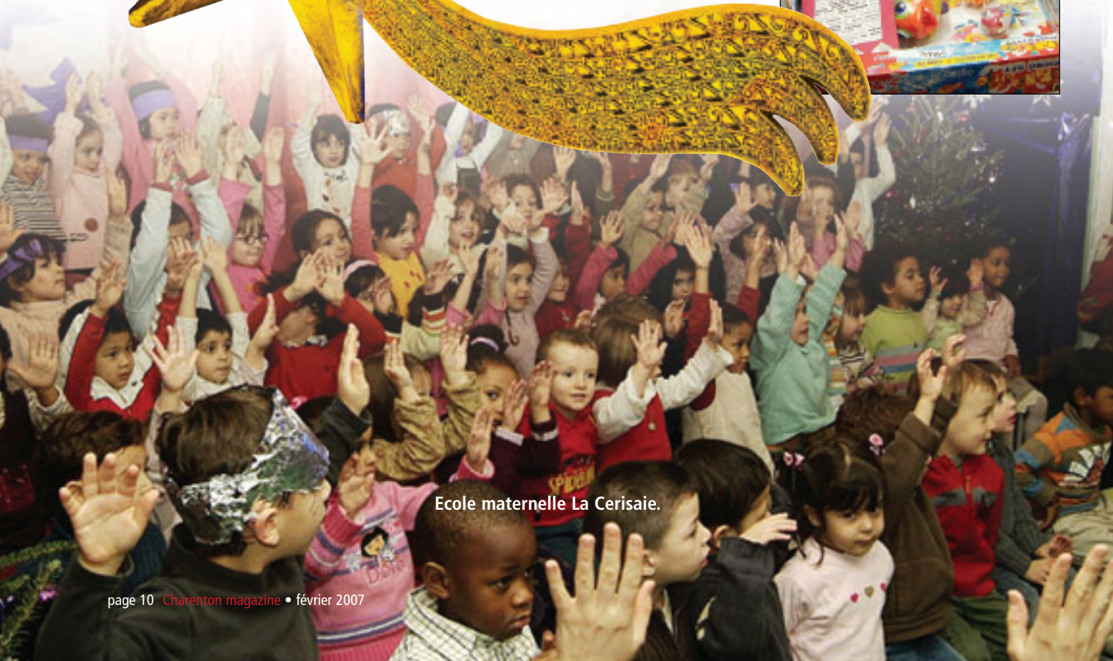
Ecole maternelle La Cerisaie.