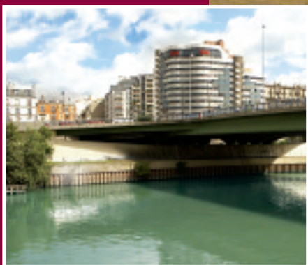
Réaménagement du Pont de Charenton