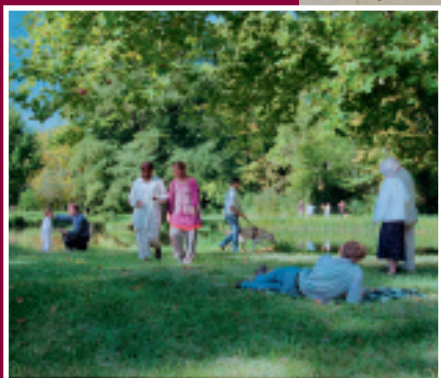
Recensement 2007, laissez-vous compter !