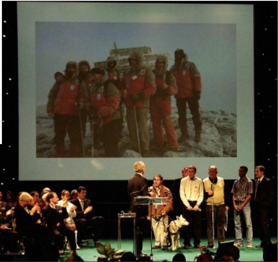
L'équipe des Cannes blanches qui a atteint le Kilimandjaro a été mise à l'honneur.