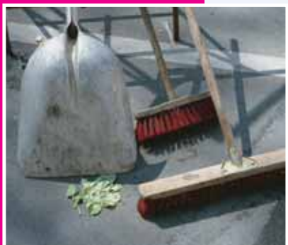
Le Grand Nettoyage: une opération à succès