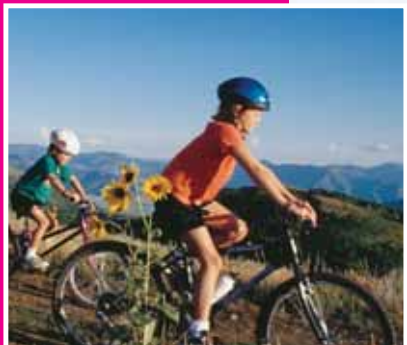
Vacances d'été: il est temps de s'inscrire