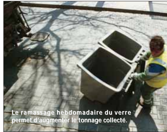
Le ramassage hebdomadaire du verre permet d'augmenter le tonnage collecté.

Retrouvez les consignes de tri sur le site Internet de la ville : www.charenton.fr