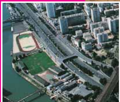
Le PLU arrêté en Conseil municipal