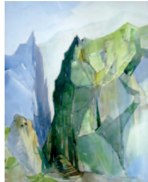
Michel MONTIGNE - Cap vert - terrasses.